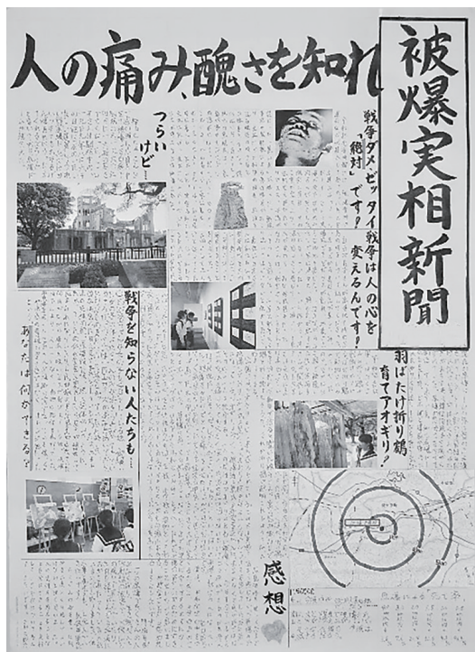
図2 直接警鐘型の新聞（生徒作成）

また、図4は啓発型の新聞である。新聞名を「平和発信新聞」とし、「広島はこれからも進み続ける」と大きく見出しを付けた。このグループは、特に次年度に修学旅行で広島を訪れる2年生を意識して見出しを考えた。広島という街の変化を見てほしいという願いが込められている。