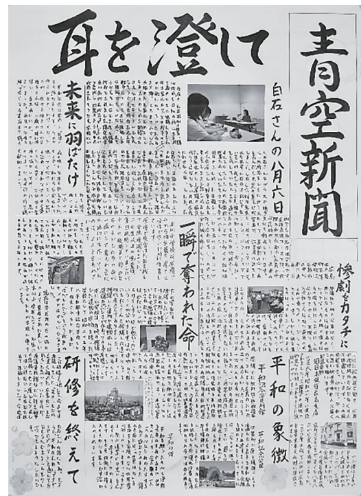
図3 間接警鐘型の新聞（生徒作成）